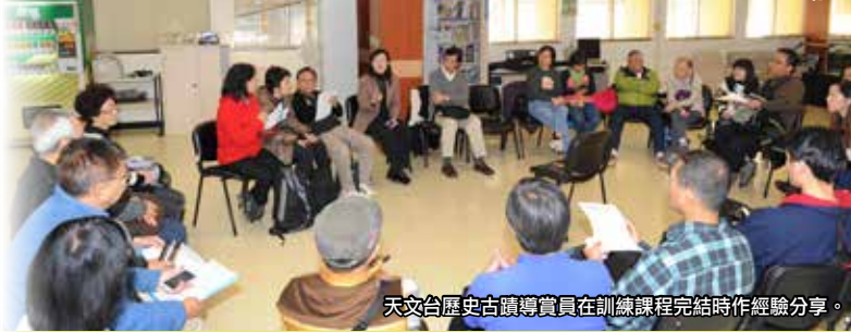
天文台歷史古蹟導賞員在訓練課程完結時作經驗分享。

天文台和長春社文化古蹟資源中心合辦「天文台歷史古蹟導賞員訓練課程」，訓練一班對歷史有興趣的社區人士，成為天文台歷史古蹟導賞員，透過他們向公眾和年青一代介紹天文台超過一百三十年的悠久歷史及法定古蹟「天文台 1883 大樓」，推廣保育歷史文化的意識。