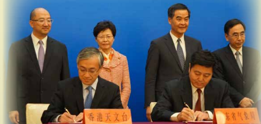
香港天文台台長岑智明（左）與署理廣東省氣象局局長鄒建軍簽署《氣象科技合作協議》。

粵港自80年代初已開展氣象合作，共同建立自動氣象站，每年舉行技術交流活動。《氣象科技合作協議》將深化及擴闊兩地氣象科技合作，繼續開拓在數值預報模式、天氣預報預警、氣候變化研究、大氣綜合探測等領域的廣泛交流，促進兩地氣象事業進一步的發展。