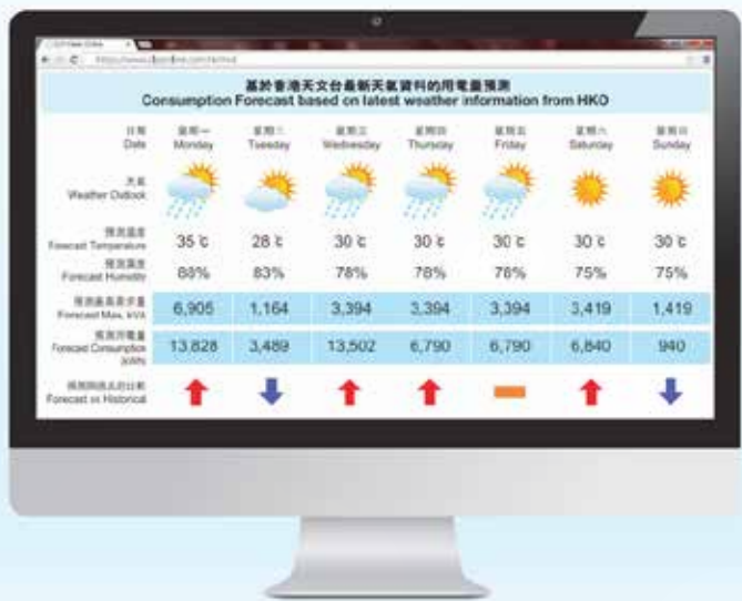
中電「電錶在線」服務中的「七天用電預測」。

為提高公眾應對氣候變化意識和促進節約能源，中華電力有限公司（中電）與天文台合作，利用天文台提供的未來七天天氣預測，在中電的「電錶在線」服務中增加「七天用電預測」功能，以協助物業管理人員預早安排節能措施，減低在炎熱天氣下的用電量，這個「睇天節能」新嘗試效果顯著，透過科技和合作帶來業界人士行為上的改變，將認知轉化成行動，應對氣候變化。