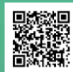
「教育資源」 電子通訊