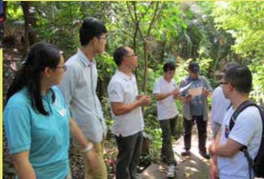
「天文台之友」導賞員學習如何介紹天文台樹林生態。

兩項活動反應熱烈，新進導賞員均表示是次訓練令他們大開眼界，增進導賞技巧，並感謝天文台導師分享天文台的點點滴滴，讓他們能夠更深入認識天文台。