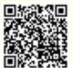
氣象冷知識 「雨幡洞」