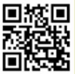
長春社文化古蹟資源中心