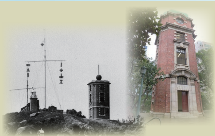
黑頭角訊號塔昔日（左）與現貌（右）的比較

尖沙咀黑頭角（又稱大包米，即現今的訊號山公園）在香港天文台的歷史上佔了一個十分重要的地位。天文台於 1885 年起在前尖沙咀水警總部（即現時「1881 Heritage」）用時間球向港內船隻報時。1908 年，天文台把時間球搬到黑頭角新建的第二代時間球塔上繼續其報時服務，並在其旁邊懸掛颱風信號，向船隻提供熱帶氣旋的消息，兩者分別至 1933 年及 1961 年為止。2015 年，黑頭角訊號塔被列為法定古蹟，天文台台長岑智明先生於去年 11 月 21 日在香港文物探知館演講廳向公眾人士介紹有關該訊號塔的歷史，內容十分豐富，吸引了超過一百名市民參加。