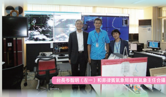
台長岑智明（左一）和菲律賓氣象局首席氣象主任合攝

香港天文台與菲律賓氣象局簽署了合作諒解備忘錄，標誌著雙方更緊密的合作。多年來，天文台與菲律賓氣象局一直在不同的氣象範疇合作。簽訂諒解備忘錄將擴闊雙方合作參與全球及區域氣象服務發展的範疇，其中包括航空氣象服務、遙測應用、數值預報產品開發、氣候預報及模擬、高影響天氣研究及氣象數據和觀測技術分享。