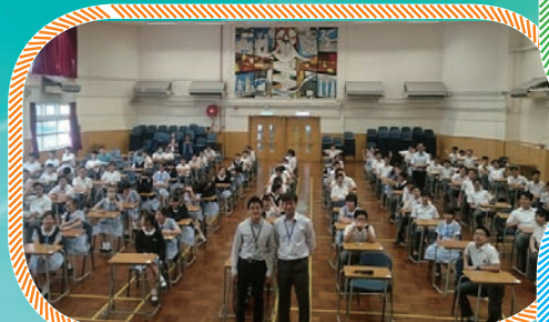
2015年10月28日，天文台與渠務署攜手合作為余振強紀念中學的百多名學生舉辦氣候變化講座。天文台總學術主任岑富祥先生（前右）與渠務署工程師陳鯉庭先生（前左）與學生們一起合照留念。