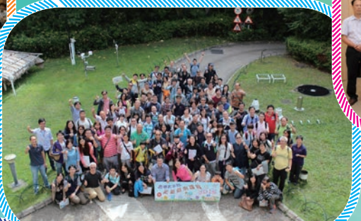
2015年10月，天文台的環境伽馬輻射水平測量服務獲得國際標準化組織ISO 9001的認證，標誌著其優質管理達到國際水平。有關工作人員一起合照。