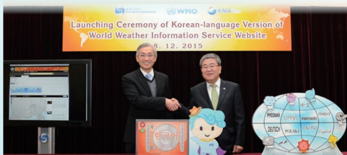
台長岑智明先生（左）與韓國氣象廳廳長高允和博士一同主持韓文版本「世界天氣信息服務」網站的啟動儀式

香港天文台與韓國氣象廳合作推出了世界氣象組織「世界天氣信息服務」網站韓文版。新增的韓文版本讓韓國語系社群更方便地獲得最新的韓文天氣資料。網站現時以十一種語言，提供全球超過一千八百多個城市的最新官方天氣預報。