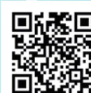
天氣與健康—冬日篇

踏入冬季，香港間中受到北方南下的冷空氣影響。香港中文大學醫學院災害與人道救援研究所所長陳英凝教授在「氣象冷知識」「天氣與健康—冬日篇」中提醒大家，寒冷天氣警告生效時，應多穿禦寒衣服、多飲水、保持室內空氣流通。享用火鍋要把食物煮熟及切勿過量喝酒。天氣寒冷較易引發呼吸系統及心肺有關疾病，大家要保重身體。